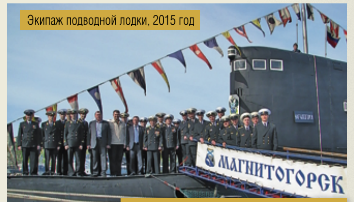
Экипаж подводной лодки, 2015 год

подводных сил Норвегии. По итогам того же года объявлена лучшей в соединении. С 19 по 21 июня 2013 года участвовала в крупномасштабных поисково-спасательных учениях вместе с тринадцатью другими боевыми кораблями, судами и ПЛ ВМФ России. В начале 2014 года была перебазируется на Балтийский флот. Вернулась на Северный флот в мае 2015 года. По данным на начало 2022 года, подлодка предположительно выведена в резерв.