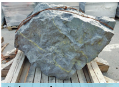
Глыба железной руды, доставленная ПАО «ММК» в Москву

проходила железная дорога, по которой ходили паровозы и, как говорят старожилы, возили броневые листы на испытание. Москва – столица нашей Родины, а Магнитогорск – столица чёрной металлургии, Москва – город-герой, Магнитогорск – город трудовой доблести. Так что наши города связывает многое, и москвичи, далёкие от нас территориально, близки нам по духу и хранят память о нашем городе.