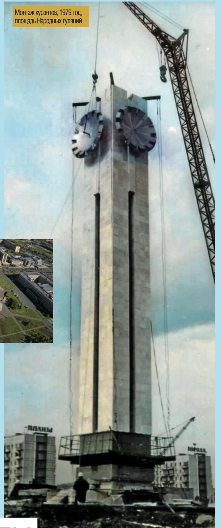
Монтаж курантов, 1979 год, площадь Народных гуляний